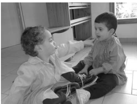
No m'ha agradat