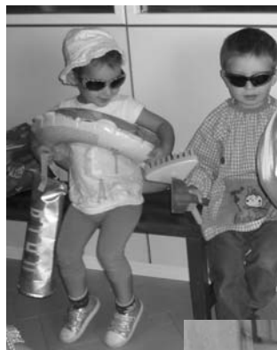
Riure d'un mateix